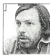
Hay que garantizar una mayor inclusión”