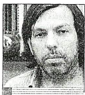
En el 2002 la mitad del sueldo era en negro”

—Hay un programa de becas del Gobierno nacional para incentivar la inscripción en las carreras tecnológicas, pero realmente en nuestro país y producto de lo que fue la década del '90, donde no había salida laboral para los tecnólogos e ingenieros, todavía no se ha revertido esa situación. Hay una falta muy importante de profesionales que trabajen tanto en las ciencias duras como en ingeniería y nuevas tecnologías; creo que ése es un déficit que las universidades públicas deberían encarar con mucha más solidez. A veces pasa que en las carreras de informática las empresas se llevan a los alumnos antes de que concluya la carrera. Es uno de los grandes problemas de hoy. En nuestro sistema sigue preponderando una gran cantidad de alumnos en carreras humanísticas, derecho, psicología, donde la salida laboral no es tan directa como en la informática.